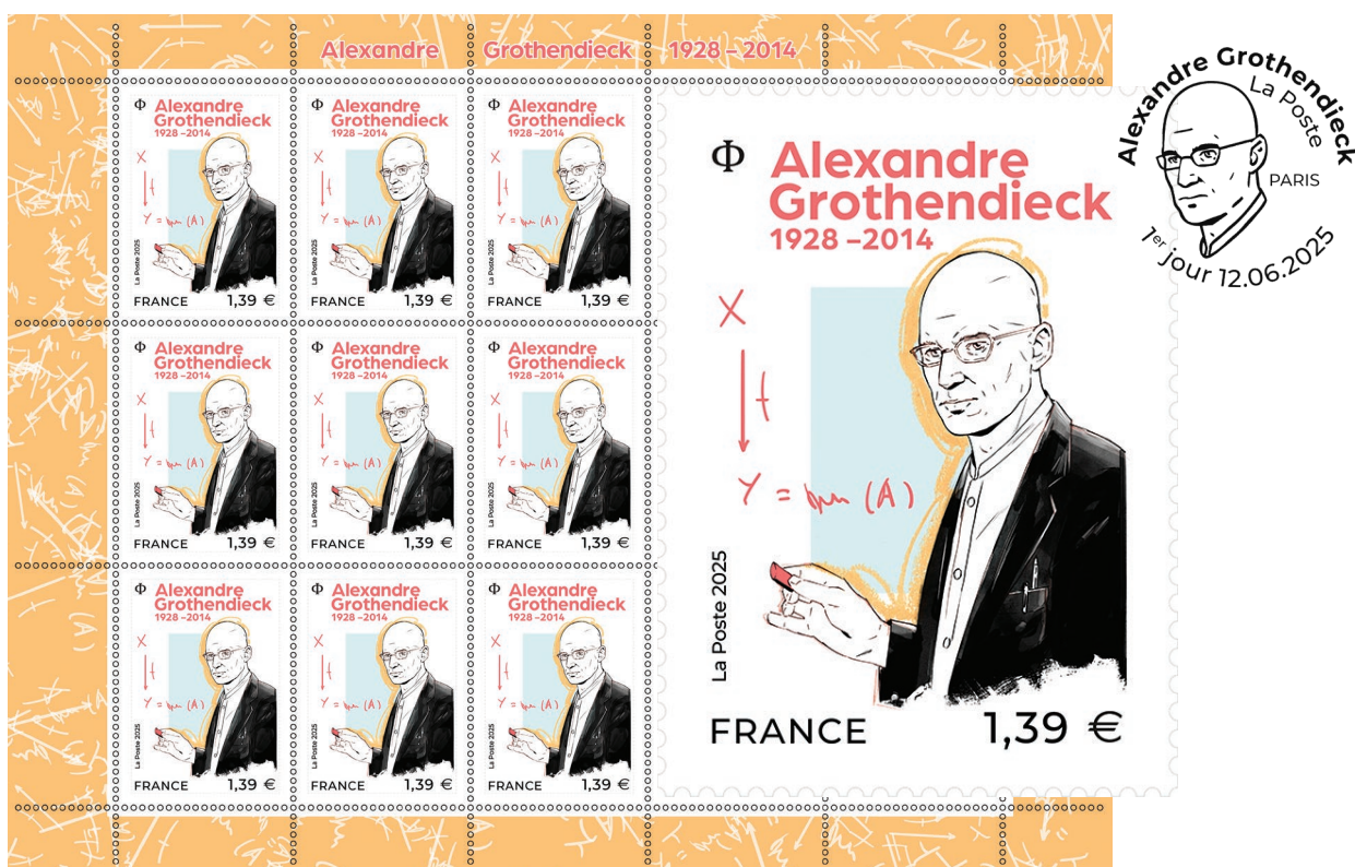
Visuels d'après maquettes - Couleurs non contractuelles/disponibles sur demande

Le 16 juin 2025, La Poste émet un timbre à l'effigie d'Alexandre Grothendieck considéré comme l'un des fondateurs de la géométrie algébrique moderne. Il est reconnu comme l'un des plus grands mathématiciens du XX e siècle, que ce soit par son génie ou ses réflexions sur son temps. La médaille Fields lui a été décernée en 1966.