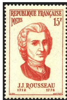
1959 - Jean-Jacques Rousseau mort à Ermenonville YT - 1084