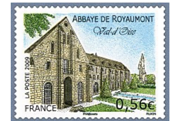
2009 - Abbaye de Royaumont YT - 4392