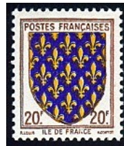
1943 - Blason d'Ile de France YT - 575