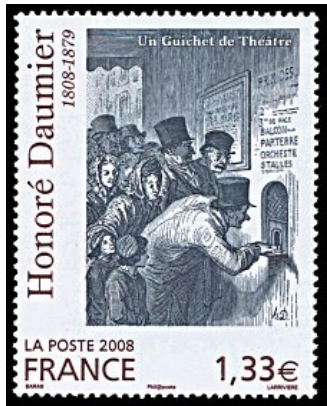
2008 - Un Guichet de Théâtre d'Honoré Daumier mort à Valmondois YT - 4305