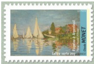
2013 - Régates à Argenteuil de Claude Monet - YT - AA829