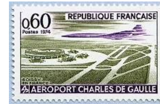
1974 - Aéroport Charles de Gaulle à Roissy-en-France - YT - 1787