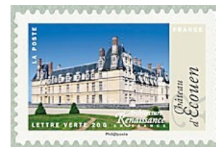
2015 - Château d'Écouen - YT - AA 1115